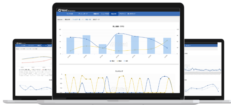
サービス画面イメージ

「Nint ECommerce」は主要ECモールのジャンル・商品・ショップ・広告等のデータを収集し、独自の推計技術により、売上トレンド等の今まで見えなかったECモールの動向を可視化することを可能とするECリサーチのクラウドサービスです。